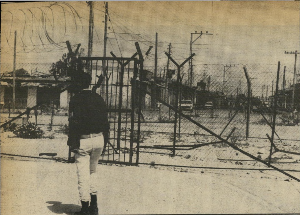
רפיח: מבט לישראל עומד ליד גדר הגבול העוברת באמצע העיר רפיח, חזיר מצרי של העיר. הגדר נמשכת לאורך שני קילומטרים לכיוון הים, ולאורך 300 קילומטרים לכיוון השני ומביט על המשך הרחוב הנמצא בצד הישראלי של העיר.