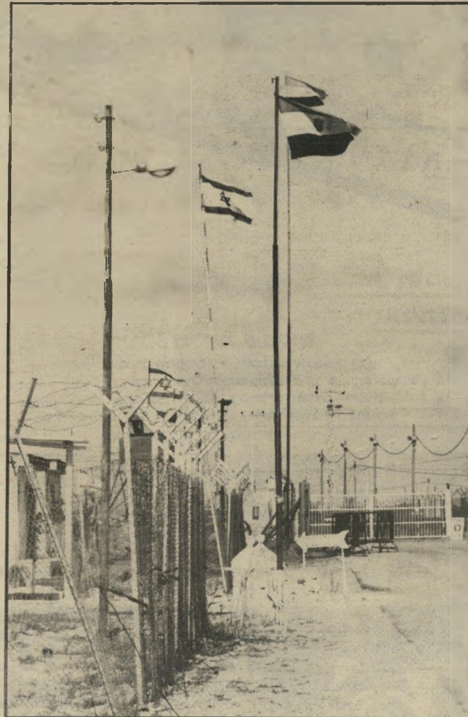
גבול השלום הגבול בין מצריים וישראל. דגלים של שתי המדינות מתנופפים בצוותא וזה אולי מה שמסמל יותר מהכל את השלום הקיים ואת האפשרות לעבור בקלות רבה מצד אחד לצד השני, ממדינה אחת לשכנתה.

הרבה כיסאות-עץ משופשפים. שולחנות קטנים, לא נקיים במיוחד, והרבה הרבה טיפוסים שונים ומ-שונים בגלאביות ומיני תרבושים וסמרטוטים אחרים על הראש. אלה היו, כנראה, יושבי הקרנות של אל-עריש. ליד הקיר ישב חייל מצרי במדים, מתנדנד על הכיסא, כשמעליו ציור גדול של הנשיא מובארכ ומתחתיו הכתובת: "למצ-כשהתקרבונו למקום, מייד ננעצו בנו עיניים סקרניות של כל יושבי הקפה. שני מערביים כמונו היוו ללא ספק אטרקציה מעניינת. יש-כנו בחוף, כמו כולם, הזמנו קפה. בעודנו לוגמים ממנו, עבר במקום