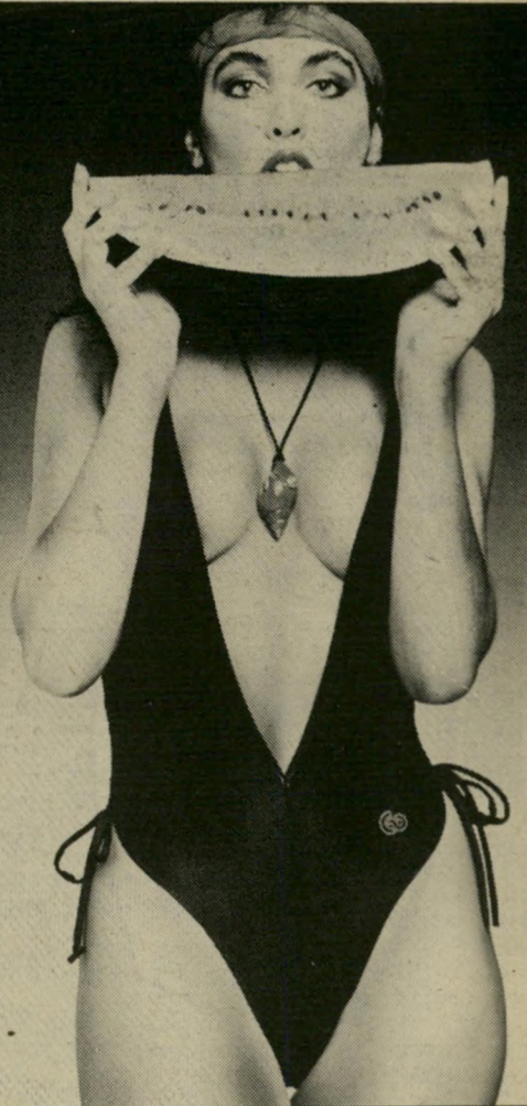
דוגמנית האבטיח היפהפיה המופיעה בתמונה הרצ'ב פותחת את עמודו הראשון של קטלוג בגדייהם היוקרתי של גרעון אוברזון לקיץ 1983. הקטלוג שעוצב בידי חברת הפרסום דגש זכה לא מכבר בציון מעולה בתחרות הפקות הדפוס הנבחרות לשנת 1983 מטעם פריזן העבודה והיצור.