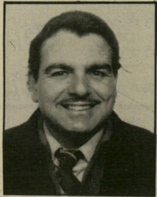
קורא איש-שלום, שונא - משמע שונא

אולם, מסתבר, ששום דבר לא ילמד אותה, אותה לא ניתן ללמד! שאול פרידלר, קריית-שמואל, חיפה