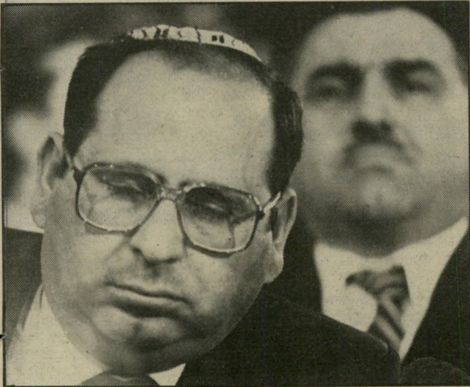
סגן-שר גזעני רובין הפליה בין תינוק לתינוק

תינוק בית: גם אבא שלך לא הצביע בעדם! תינוק אלף: תגיד, אתה בכלל יהודי?