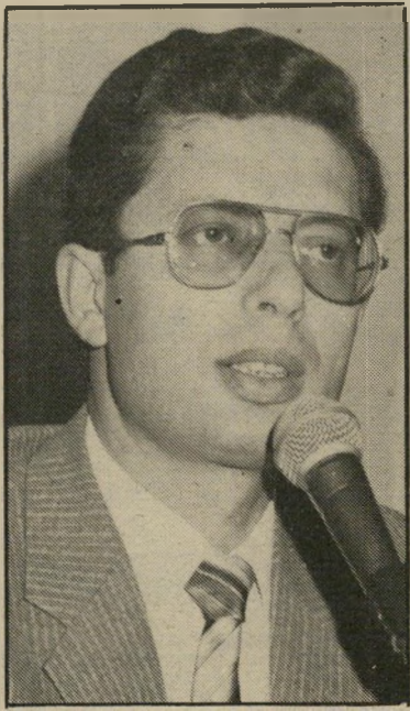
רופא זימר רפואה אחרת

לרוויקם, גם לרוויקת, וגם לסתם עצל-נים: פנסט לא כלליך חוש. אבל לעומת זה, יעיל מאוד. מכין קפה או תה אוטר מטי"י. כולל שעון מאיר ומעורר, רדיו א-פאם ואי-אם. נו, מה אתם אומרים? הולכים לישון מתי שהולכים, אך לפני זה דואגים לכוון את המכשיר לשעה הר מתאימה, ובדיקת בבוקר מתחיל השעון לטרטר, הרדיו לנגן והקפה או התה לר תוח. אפשר לשנות פעמיים. ובמיקרה של בתווג או ביווג — פעם אחת קפה ל-שניים. הוא הדין בתה. ועכשיו העיקר — המחירים: החל מ-50 דולר בלי רדיו, וגמור במכשיר המשולכל ביותר, עם רדיו, טיימר לרדיו, וטיימר לשעון, במאה דולר.