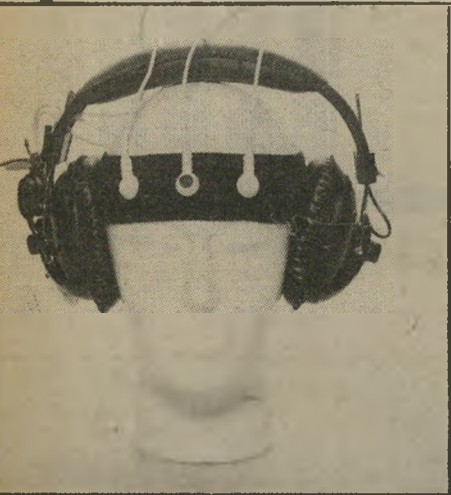
אוזניות נגר כאבראש מתנה לחותנת

אין כמו ג'ה-הפסח לקבלת מתנות. הנה כמה הצעות יוצאות מגדר הרגיל למתנות חג. כל חג. לפני שנתחיל ולפני שניציג את המתנות, חובה עלינו לציין את המקור: כמה רש"ת תות שיווק בארצות-הברית ובאנגליה, הן מציעות מתנות בלתי-אפשריות לכל אחד, בעיקר על-ידי הזמנה בדואר, אך גם לקניה ישירה בחנויות מיוחדות. משהו מיוחד לחותנות, שתמיד יש לה כאבראש בזמן הלא מתאים. יקר, אבל