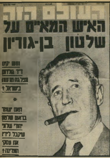
"העולם הזה" 1069 תאריך: 26.3.1958