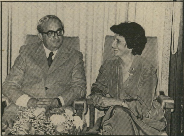
עם הנשיא מינהגי אירוח —