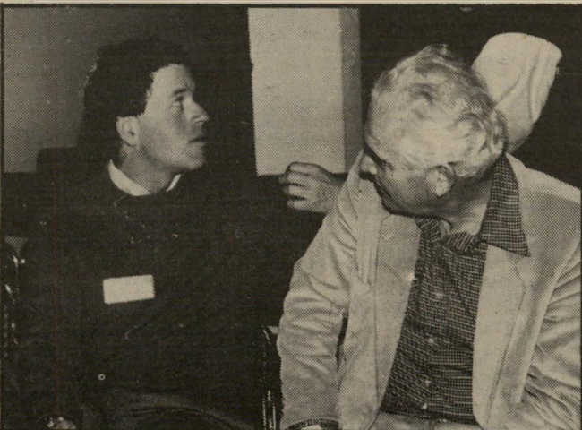
משוחח הד"ר מתי פלד באחד הכינוסים של חיילים נגד שתיקה. במהלך המלחמה הירבה להופיע בהפגנות המחאה נגד המלחמה בלבנון.

במלחמת סואץ היה פלד מפקד מרחב שלמה ורצועת עזה, ואחר- כך פיקד על החטיבה הירושלמית.