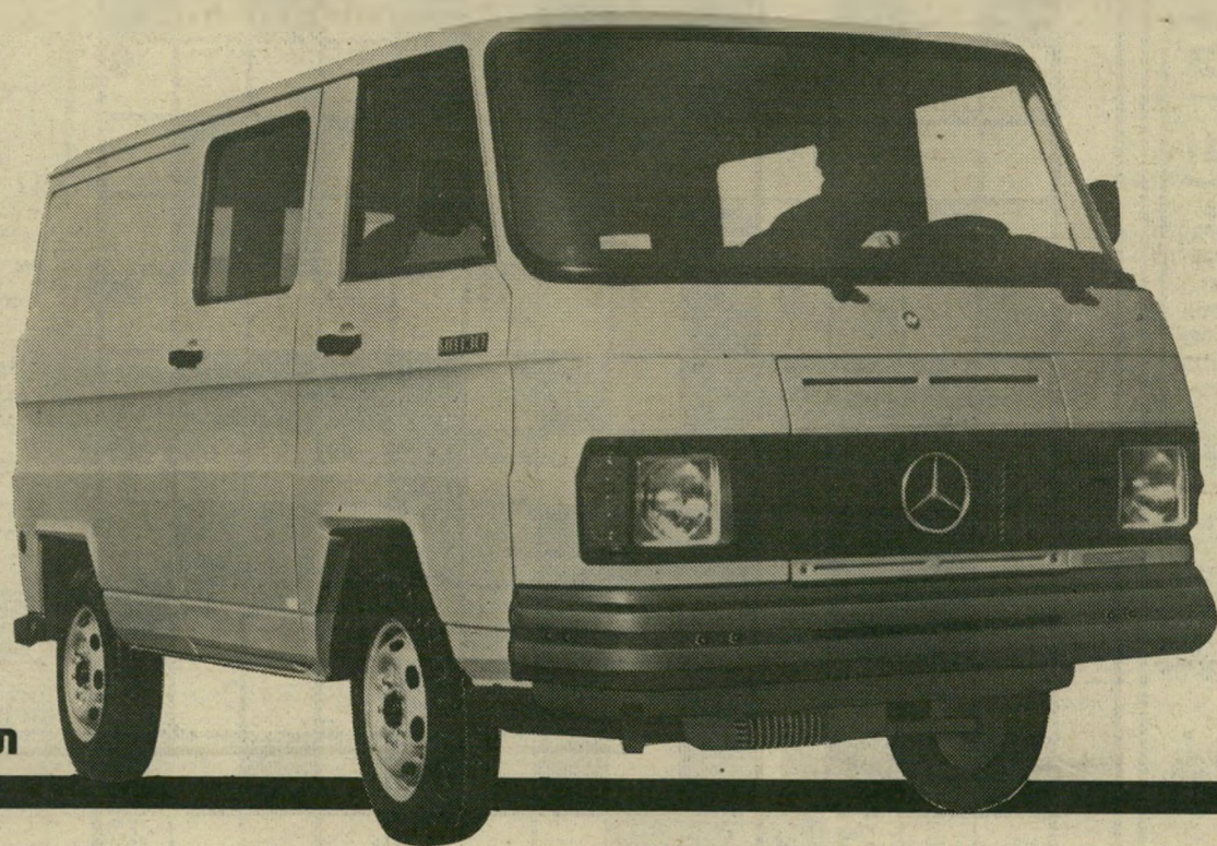
תנאי אשראי נוחים

כמו ברכב פרטי. מרחב הראיה הוא מעולה והוא הטוב ביותר שאפשר למצוא ברכב מסחרי אירופי. תא הנוסעים מרווח והדלתות הן רחבות, ונוחות להטענת מטענים. כשמחברים את כל הנתונים האלו יחד, מקבלים רכב מסחרי שאין לו מתחרים בנושא של אמינות ובטיחות. הוא חזק כמו משאית ונוח לנהיגה כמו רכב פרטי. התחזוקה שלו היא חסכונית ביותר. מרצדס קומבי הוא רכב מסחרי בעל גימור פנימי וחיצוני מושלם והוא הבטוח האמין והנוח ביותר להובלת מטענים ולהסעה עד 9 נוסעים. אתה מוזמן לבקר בסוכנות מרצדס ולראות את מרצדס קומבי המסחרית, לבחון אותה, ולקבל פרטים נוספים על רכב מופלא זה.