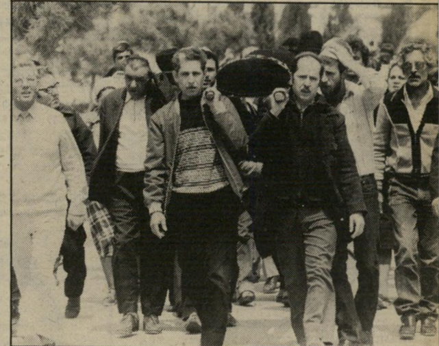
הלוויית שולמית שלי "אני נפלתי קורבן"

ברים וגם לא אנשים מישטרה ישיתי עסקים. בחקירות במישטרה ואלו אותי על מיקרים רבים שקרן ארץ בעולם-הפשע. חשבו שאוכל הוסיף אינפורמציה. אני דיברתי ק על המיקרה של הרצל הכפול. יברתי אמת. אני מאמין באלוהים אומר שביני ובין שמעיה, מי ש- זשקר יקבל מחלת סרטן. אני יודע שכשבוחרים בדרך הפשע ומתעס- ים בסמים, צפויים תקופות מאסר גמושכות. והיות שאני חי ככה, ני מוכן לשלם את המחיר.