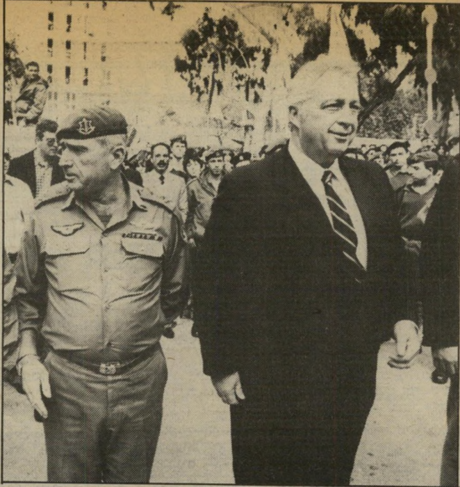
שרהביטחון אריאל שרון ורמטכ"ל רפאל איתן תומכים נלהבים

(המשך מעמוד 9) עלידי הפגנות נגדם ותביעות ל- סלקם מתפקידם. שרהפנים, יוסף בורג, מוצג במיסמך כאוייב המסוכן של ה- מתנחלים, ומוצע לדרוש את ה- לפתו. מחברי המיסמך גם קוראים לאנשי גוש-אמונים לסכל כל אפי- שרות שעזר וייצמן יחזור לחיים הפוליטיים. לגבי הרהיבת נאמר במיסמך: "יש לשקול אם מן הראוי לה- משיך ולהפקיר נושא חינוכי ומרכזי זה".