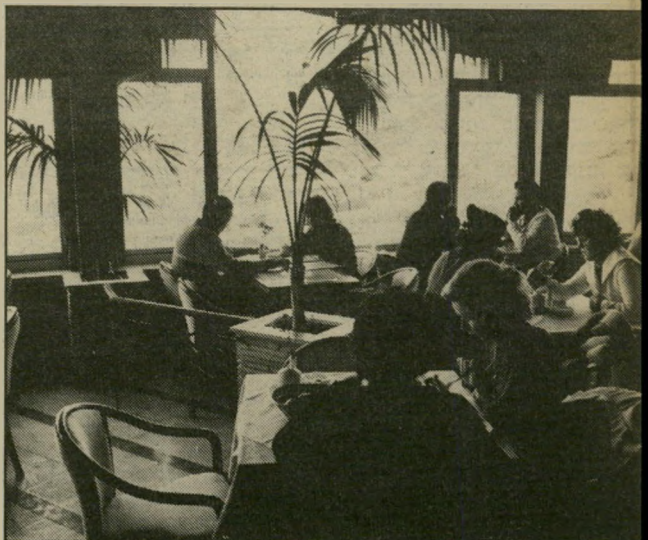
נכשיו קפה סילץ כפי שהוא נראה היום, במבט מבפנים לכיוון הים. הארכיטקטורה של המקום השתנתה לסיגנון ארידוקו, בל יושבי הקפה דאז חזרו אליו, והם ממלאים אותו בתלבושות הדורות.