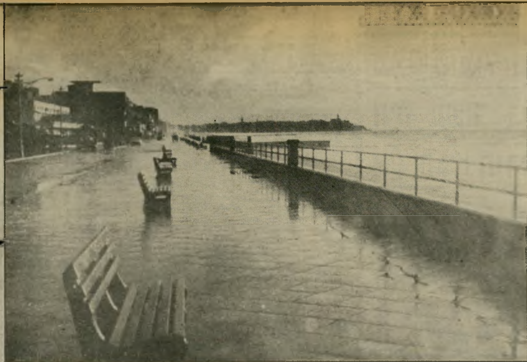
הטיילת 1938 מראה הטיילת ב" תחילתה: ספסליי העץ היו פונים אל הים, עליהם ישבו המטיילים כשהם צופים אל הים. אז עוד היה מעקה, שעליו היו נשענים האוהבים בליק ירח. בשנים האחרונות נשאר הספסלים ריקים מאדם.