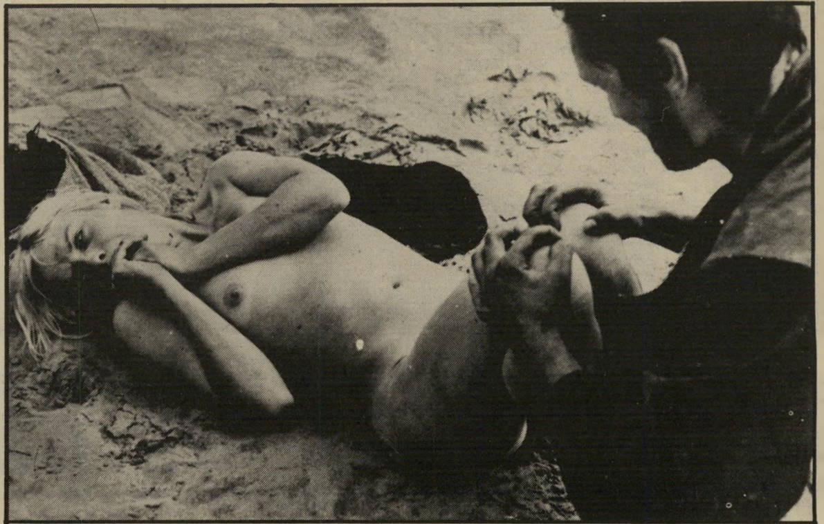
"המגויים" סירטו של רולאנד ורהאורט תמונת אונס בסרט היסטורי

טת היוצר גדולים יותר, ואילו ההשתעב-דות לתכתיבים מסחריים קטנה יחסית. ולבסוף כדאי לציין שאחת הבעיות הי-חמורות של הקולנוע הבלגי, (ושל אמצ-עי התיקשורת האחרים בבלגיה) היא התי-הום המעמיקה שבין הפלמים והוואלונים הגרים שם. מצד אחד יש הרגשה ברורה שהוואלונים חשים קרובים יותר לשכנה מדרום, צרפת, מאשר לבני ארצם הפלמים. ואילו הפלמים מתייחסים להולנדים, המדי-ברים למעשה את אותה השפה כמוהם, כאל שארייבשר קרובים יותר מדוברי הצרפתית שגרים בדירה שממול. לתופעה הזאת יש כמה תוצאות לוואי. למשל, העובדה שמתן הודמנות שווה לשני