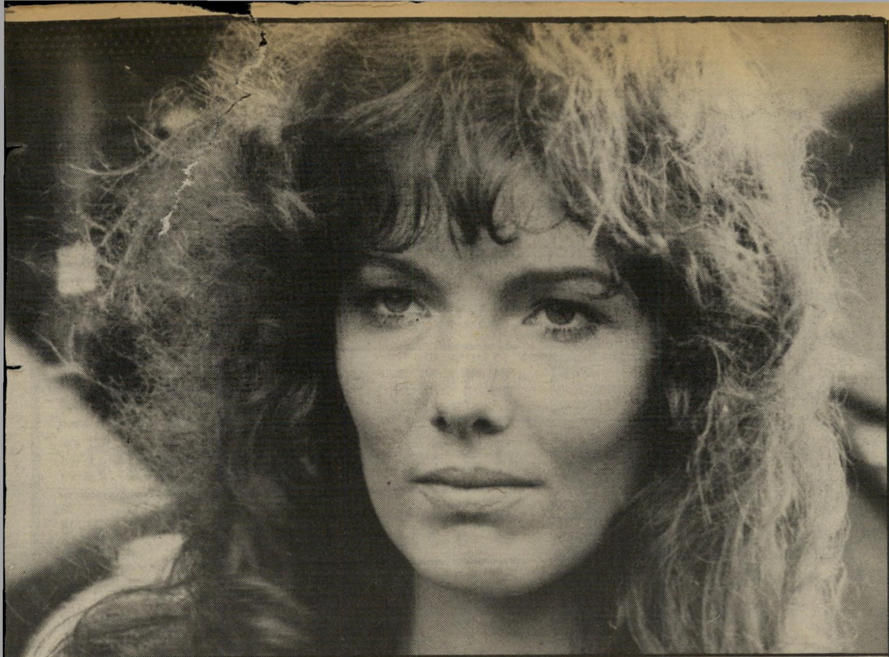
וילקה ואן-אמלרוי ב"מירה" של פונס ראדמקס אחת השחקניות המפורסמות של הולנד

ואמנם, התכונה הבולטת ביותר בסידרת הסרטים המוצגת כאן, היא האופי הלאומי המובהק של כולם. בין אם זה אשה בין ערביים של אנדרה דלו, המיטה של מאר-יון הגול (המבקרת עתה בישראל), מירה, סרט שבויים בבלגיה עליידי ההולנדי פונס ראדמקס (על הקירבה בין שתי ארצות השפלה יש בהחלט מקום להרחיב את הי-דיבור) או המגויים של רולאנד ורהאורט, סרטו של דלו, הידוע בין קולנועני בלי-גיה, הכניס הרבה אנשים בבית, ובעוד כמה ארצות אירופה אחרות, למבוכה מסוי-יית, משום שהוא מספר על אשה שני-שאת לפלמי המשתף פעולה עם הנאצים, מתוך תיקוה שהנאצים יגרשו את הצרפ-תים מבלגיה, ומתאהבת אחר-כך בפעיל-פחתת ואלוני (הוואלונים הם הבלגים