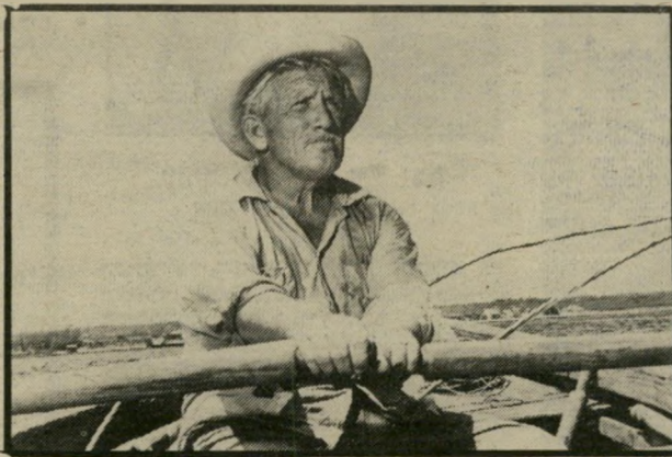
מרייפי: הזקן והים יום שישי, שעה 10.15

מבט שני: אתי מזבנון (9.30) שידור בצבע. מדבר עברית. סרט "מורשה" העוסק בבחורי- ישיבות-ההסדר, והשפעת מיל- חמת-הלבנון עליהם. בידור: טובים ה- שניים (10.10) שידור בצבע. מדבר ומזמר בי- אנגלית. הזמר ג'ון דגור מראה את הקומיקאי ג'ורג' בארנס בהופעה פומבית. סידרה: לא יאומן כי יסופר (11.10) שי- דור בצבע. מדבר אנגי- לית. והפעם הפרק הייתם מאמינים? המבוסס על סיפור- אימים.