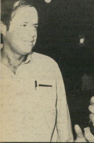
ח"כים ריימר וקליינר דויד לוי נגד ארנס

אחד המפסידנים העיקריים הוא יצחק שמיר, ארנס אינו רוחש לו חיבה יתרה, מאז תקופת היותו פות בארץ לשדרים האישיים שלו מארצות-הברית לאנשי שמיר.