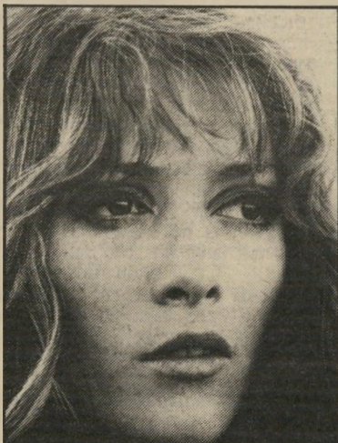
עורכת ישורון שיר מביירות הנצורה

ספר חביב שראה אור באחרונה הוא המאהב החמקמק מאת דניאל גולדסטיין + קפרין לרנר + שירלי צוקרמן + הילארי גולדסטיין, שכותרת המשינה שלו היא "...והשאר תפקידים שאנו מגלמים באהבה, כמין ובחי הנישואין". ספר זה בוחן אביטיפוסים שונים במער רכת המינים: את התמימות והחודרה, המתחשבת, המפרנט, המצליח, האשה הש" בירה, המטיב, הקורבן, הורוק, הקשוחה-שבירה ואחרים. זה ספר שנועד לעסוק במין, והפך לספר העוסק בחיים שבינו לבניה, חיים המלווים בגירסה זו בקטעי שירה, שהינם בבחינת כימט-אנתולוגיה לשירה אמריקאית ואנגלית. המאהב החמקמק הוא בעצם "ספר מין" המיועד לשכבות גבוהות יותר של החבר, ספר שיש בכוחו לרכך לא מעט חיכוכים בין בני זוג משכבות אלה.