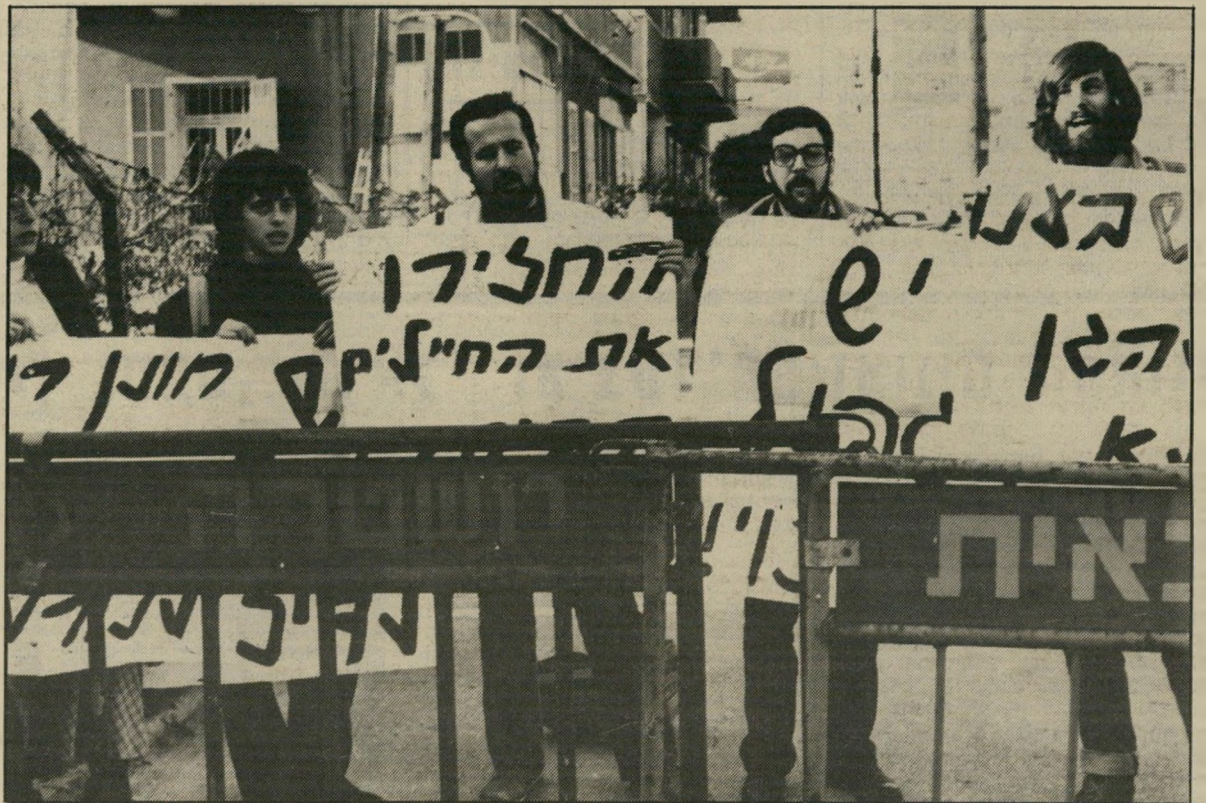
שביט (מזימן) בהפגנה נגד הרמטכ"ל במישפט הסיפור שיר האחירון כל לילה לפני השינה

מישהו שינה את כתובת האבנים מקצינים לטרבנים. מעניין שאף אחד לא שם לב לכך שהכתובת אינה תיקנת על פי הידוע לי — עד כשבועיים אחרי (המשך בעמוד 64)