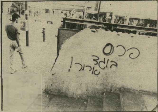
כתובת נאצה בתל-אביב מוטב להירוק מאולם המליאה -

אל תרשו את הביזוי, אל תר- שו רגע אחד נוסף של ניאוף שמי- עון פרט, אל תתנו למשפט הס- תה אחד לעבור מעל ראשיכם ל- אוזני ההמון, ללא תגובה. היגררו- על-ידי הסדרנים מן האולם, אבל