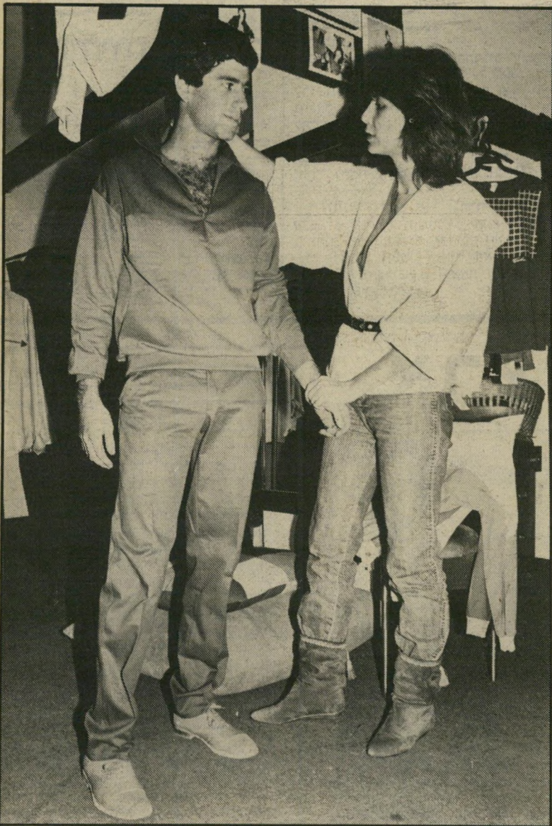
מולבש צעיר מודה בגאווה: „אני אוהב שיפה מלבישה אותי. אני סומך עליה בעיניים עצומות. יש לה טעם נהדר גם בשילוב צבעים וגם בהתאמת הבגד. אני הפכתי לקוח קבוע אצלה.“

דון ובפאריס. כמו שרואים בכל ירחוני האופנה. רוב הגברים שמגיעים אלי הם חסרי כל טעם בלבוש, ללא ידע והבנה בצבעים, וחסרי נסיון. אך הם רוצים להתלבש יפה, והם סומכים עלי. הם ירדעים שמה שלא נראה יפה עליהם אני