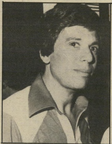
מגיש ארבל אין להתלבש?

הוי"ד שגיב, מנהל קול ישראל בעריכת, שהגיש את התפטרותו בשבוע שי עבר למנכ"ל הרשות יוסף לפיד, לא שיער בנפשו כי בהתפטרותו יחשוף את רשות השידור ההציי-שילטון חזקים יותר. הסיבה להציי-שילטון נעוצה בטיבו של קול ישראל בערבית, הנחשב בעיני הי שילטון למכשיר תעמולתי יותר מאשר למכשיר דיווחי. חוגי ביטחון שונים חו'