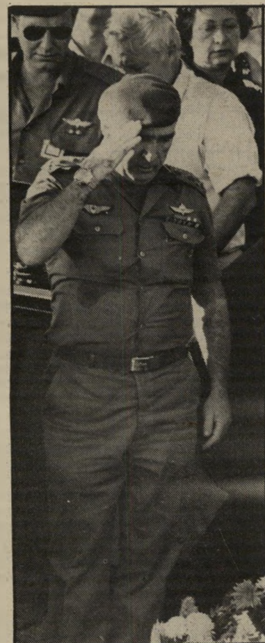
רמטכ"ל איתן בהלוויה מילחמה למשן הפלאנגות

הוועדה נהגה ברב-אלוף רפאל איתן כסלחנות רבה, ולא הביאה כלל את ההירדעות הכוזבות שמסר לעיתונאים אחרי שנודע על הטבח. בדו"ח הוועדה נמסר כי רפול הודיע שוב ושוב לממונים עליו שכל ביירות נמצאת בידי צה"ל, מחנות הפליטים מכותרים מכל עבר, וצה"ל מקי יים בידיו שליטה מוחלטת במתרחש. היר