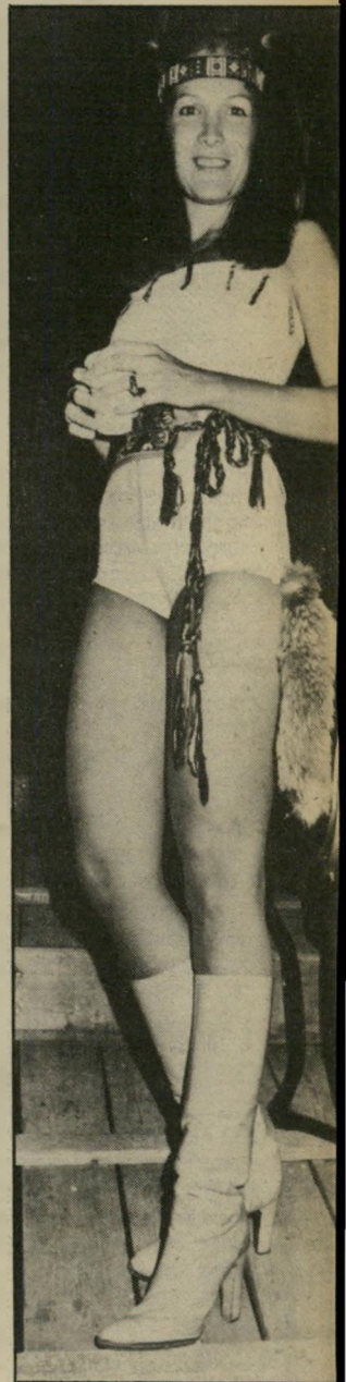
מסיבנית פיניצ'י הגיגה אחת גדולה

זיל כשיצאתי לשוק כדוגמנית. תוצאה מהתמונות שלי, שהתי- וילו להתפרסם, התחילו לכתוב עלי בטוריה-הרכילות. תמי טיסקה הרבה חומר לטוריי- הרכילות, בעיקבות חברה המפור- סם, שחקר-הכדורסל אולטי פרי. ליום מבוקשים השניים בכל אירוע גלם. אני לא הולכת לכל אירוע שמומינים אותי, אני תמיד נותנת גדיפות ראשונה לאנשים שאני מכירה. גם לי יש אינטרס לבוא אירועים. תערוכות מאוד מעניי- ת אותי, למשל. לפתיחה של פה פילץ הלכתי ונהגיתי מאוד.