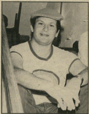
כתב זלינגר מיטעדן בדרך

ועכשיו אנחנו גזיעים לסיפור של הר שבוע, על כתב רזין, אבל בירושלים, שהולך לעיסקי מסעות-בריתאיטרוניג'או ותיומורת של בית, ויחד עם כל אלה