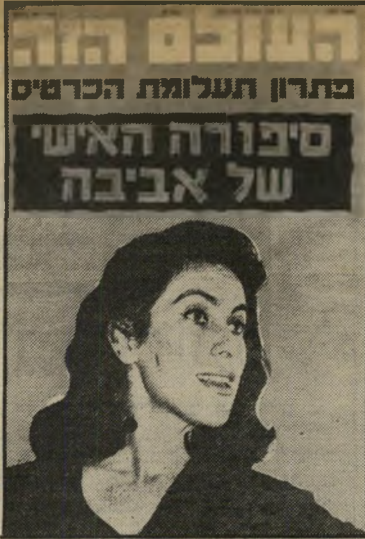
"העולם הזה" 1065 תאריך: 26.2.1958