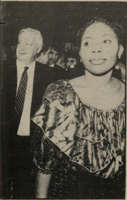
התירוצ שרון צועד לאולם אחרי אחת הארוחות מזאיר, שלכבודן כביכול נערכה המסיבה.

הנה, היה נדמה שמישהו מפר את שימי- חת השר ואורחיו. לעבר השולחן התקדם שמחה הולצברג, האישה המתפרנס מכל מילחמה. הוא משך אחריו קבוצת נכים, נפגעי המילחמה האחרונה.