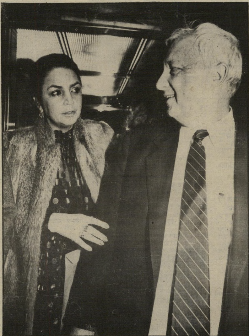
גיבת הזליקה היתה בעיצומה. אר- רחיו של אריק שרון במסיבה שהוא ערך לכבוד מישלחת צבאית מזאיר, זללו ללא הרף. שר-הביטחון עצמו אכל כשר ריר נוזל מפיו. אכל ושתה ברוזמנית. כשהוא ממתיק סוד עם היושבים לשולחן המכובדים.

לעומת זאת לא ברור מה עשו שם ה- עורך האתראי של ידיעות אחרונות נח