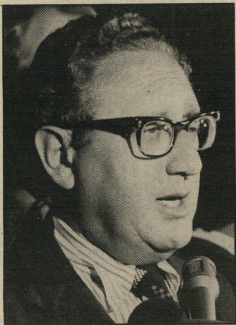
הנרי קיסינג'ר חוצפה תהומית

החרפה, בין המיעטים לכבוד הדמוקרטיה הישראליה היה גם הד"ר הנרי קטינג'ר. צליל בהחלט צורם במקלה הכללית. בישראל הקרנת של 1983 לא נמצא מי שיאמר לקטינג'ר מפורשות: "אתה אשם בפשעים חמורים ביותר, באחריות ישירה למותם של מאות אלפי אזרחים בדרום-מזרח אסיה, אל תחלק לנו ציונים. ארצות הברית עדיין לא מחתה את החרפה, שאיש לא חקר את מעשיך שלך!"