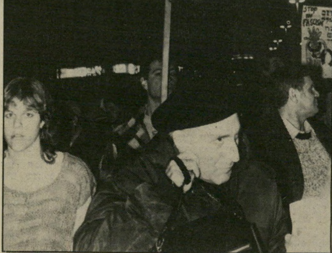
שרון כהפגנת "חונקר נגד המלחמה בלבנון" דם ודמעות

רפאל איתן עומד לסיים את תפקידו כרמטכ"ל. הוא הורשע באחריות עקיפה לאחד מפשיערי-המלחמה הגדולים של הדור. זה לא הסריע לו במאומה להשמיע את קולו, ואף להציע את יורשו. הירוש: אביגדור בניגל, המכונה יאנוש. לא היתה זאת בחירה מיקרית. מבחינות רבות, יאנוש דומה לרפול. מותר לרפול לראות בו את ממשיך-דרכו, מכמה בחינות. עד כה לא השמיע יאנוש הצהרות אידיאולוגיות רבות - אך גם רפול לא עשה זאת לפני שהתמנה כרמטכ"ל. אז התגלה השתקן המיקצועי כסטסן שאין מחסום ללשונו. לפחות פליטתה אחת של יאנוש זכתה בתשומת-לב רבה. היה זה כאשר אמר - כפי שפורסם מפי עדי-שמיעה - כי האוכלוסיה הערבית בגליל היא סרטן בנוף-המדינה. באותם הימים היה יאנוש אלוף פיקוד-הצפון, האחראי לביטחון הגליל. הדברים היכו גלים, גרמו לסערה, ויאנוש הכחיש את הנוסח שפורסם. גם מבחינה צבאית, יאנוש הוא דמות השנויה במחלוקת. הוא קצר תהילה מוצדקת כמפקד כוח של טנקים במלחמת יום-הכיפורים. אז, בימים הראשונים של מבוכה הלם, כאשר הסורים הציפו את רמת-הגולן, הצליח יאנוש לארגן הגנה יעילה וגיידת, תוך ניצול מירבי של מעט הטנקים שהיו בידיו. היה זה ביצוע יעיל ומוצלח של מפקד קרבי בדרג חטיבית. אך מכאן יש צעד ענק עד לביצוע מוצלח בדרג צבאי בכיר. רפאל איתן כבר הוכיח כי מטיף מצויין ומגיד טוב יכול להיות רמטכ"ל הרה"אסון. במלחמת-הלבנון היה יאנוש אחראי לגיזרה הסורית. למרות העליונות העצומה שלו על הקרקע, והשליטה המחלטת של חיל-האוויר בשמיים, לא הצליח להגיע אל היעדים שסומנו לו. בגיזרה של יאנוש אירע אחד הביזיונות הצבאי-איים הגדולים בתולדות צה"ל: הכישלון בקרב של סולטאן-יעקוב, שבו נכנס כוח-שיריון של צה"ל למלכודת ג'מ סורית קלאסית, והושמד כימעט כולו.