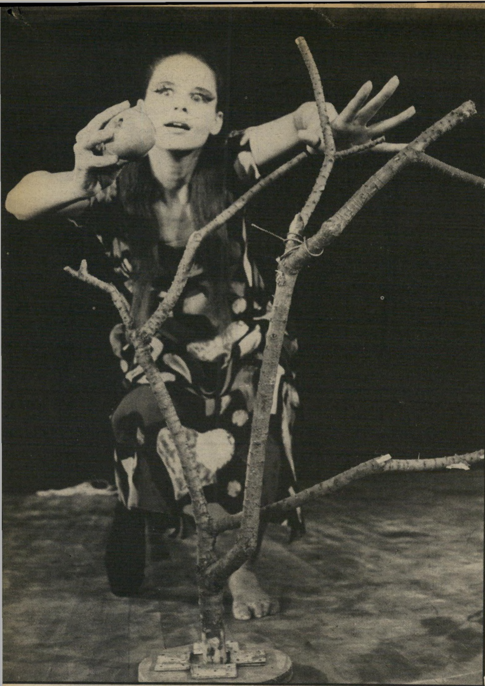
הריקוד — פרי יצירתה — בוצע בלהקה במשך שלוש שנים והיה שילוב של הומור ושובבות. היתה זו היצירה הישראלית הראשונה שיצאה לאירופה.