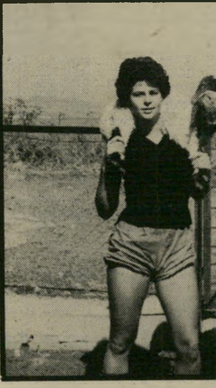
בחווה אושרה נולדה בנתניה למישפחה שקלאית שהתגוררה ברמת-טיימקין. כילדה בילתה הרבה שעות בשדה עם ארבע אחיותיה ואחיה. האם היא ממוצא רוסי והאב הוא ממוצא ספרדי.

ר-ת-שבע והירוטשילד החי ליטה להקים את בת-שבע. היא הקימה ברוזמנית שתי קבר צות תיאטרון — אחת בניו-יורק