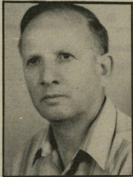
קורא רזנר חלל חי

בהיותי קטן / סחה סבתאי / כשתגדל נכדי / נחיה בשלום. // איני יכול להשתחרר / מזוועה ששמה / מילחמה. // עד הייתי לראשונה / השת- תפתי בשניה / הרגתי אני / שלא יחרגו / אותי. // שער בר בדרכי חייל / בצער אני משפיל עיני / כרואה בו /