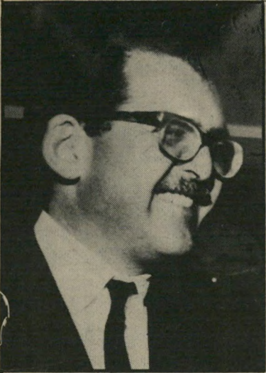
בעל-בנק רופשילד הנאמן של ג'ורדש

עד היום הייתם בטוחים שג'ורדש זה ג'נס. יש לי חדשות בשבילכם. מהשבוע זה גם קרן-נאמנות. רק השבוע הוגשה לבורסה טיוטת תשקיף של קרן-נאמנות חדשה בשם אב.