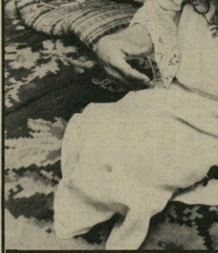
ראשית רינה שני אדם אוניברסאלי

מוקי טען, שהוא רוצה לעזור לה, מכיון שהיא זקוקה לתמיכה. הוא ראה בזה אתגר. פיתאום, יום אחד הגיע להחלטה שהוא עוזב את הלימודים ואת המשק. אחרי- כך הסתבר לנו, שנסע עם הב- חורה לשני ביקורים במגדיאל. אנחנו לא ידענו כלום.