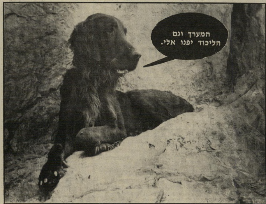
גינני, סטר אירי