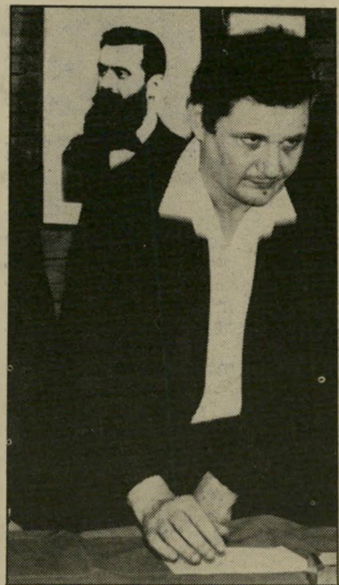
שר ארדור הדלפה

ביום החמישי כבוקר הופיעה הידיעה על כוננת האוצר להגביל את פעולת הקרנות בידיעה ש"ר שית או רביעית. כדומר: בעצת חשיבות מישנית. כשהופיעו ע"י תוני-הערב, המופיעים אחרי הש' עה ע בבוקר, התנססה לאורך כל רחב העמוד שז, "מעריב" כר תרת ענק על כך שהאוצר יגביל