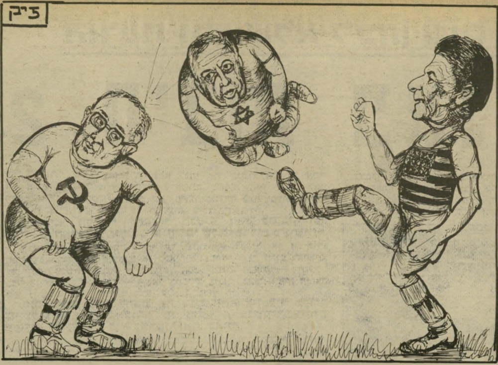
כאשר נדמה לכדור שהוא שחקן

רדיו מונטה-קארלו הוא כלי-התיקשורת מס' 1 בעולם הערבי. תחנה זו, שעורכיה יושבים בפא-ריס, המשדרת מנסיונות מונאקו,