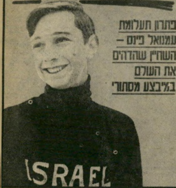
בתרו תעלומת עמנואל פינס - השחין שהרהיב את העולם במיבצע מרסטריו