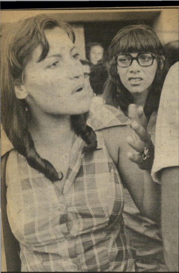
רבדה דוברת רשות השידור