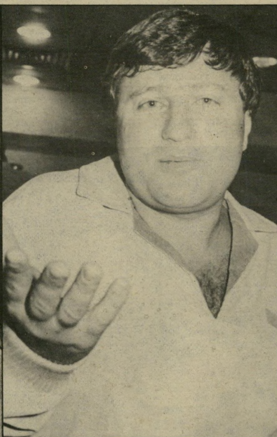
ברגמן סוכנות יהודית