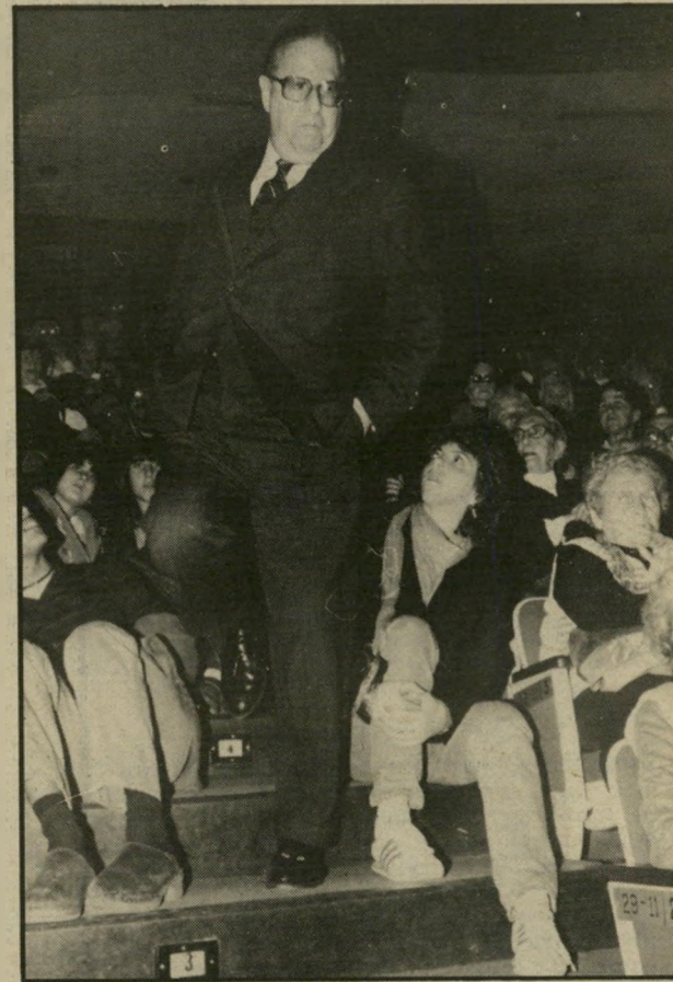
מפלס את דרכו במדרגות מוסיאון תל-אביב, שם נערכה האזכרה לגולדה מאיר. אבן בא באיחור ובקושי הצליח להגיע למקום שנשמר עבורו. המעברים היו חסומים עליידי בני-נוער שחובאו במאורגן.

ביום השני השחור של הבורסה עמדו כמה מח"כי המערך במיזנון. רענן נעים הביט בפליאה בחליפתו של