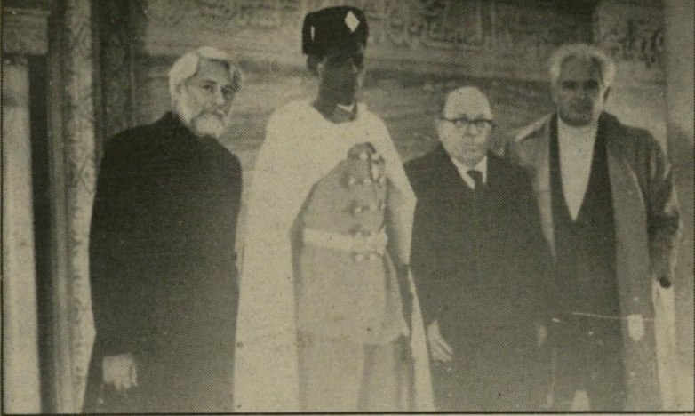
פלד, ארנון, אבנרי ושומר מארוקאי במאוזוליאום של מוחמד ה-5 למען אסטרטגיה של שלום.