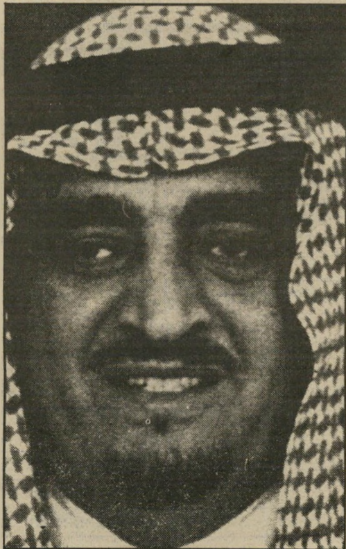
המלך פאהד הכל נשאר במישפחה

גם נסיכוּן. נשאר, אם כך, 3 מיליארדים נוספים. גם זה עשוי להיחשב כסכום כסף לא מבוטל. לא בדיוק, בימים אלה זכה מתווך-קרקעות סעודי, נסיכון ממדרגה נמוכה יחסית, ב-54 מיליון דולר כדמי-תיווך בעסקת-הענק. החברה הצרפתית נאלצה לשלם, ואחד ממנהליה הדליף לזה טונד, שסכום זה אינו אלא קצה הקרחון מ-540 מיליון הדולר ששולמו ל-גורמים מרכזיים במישר