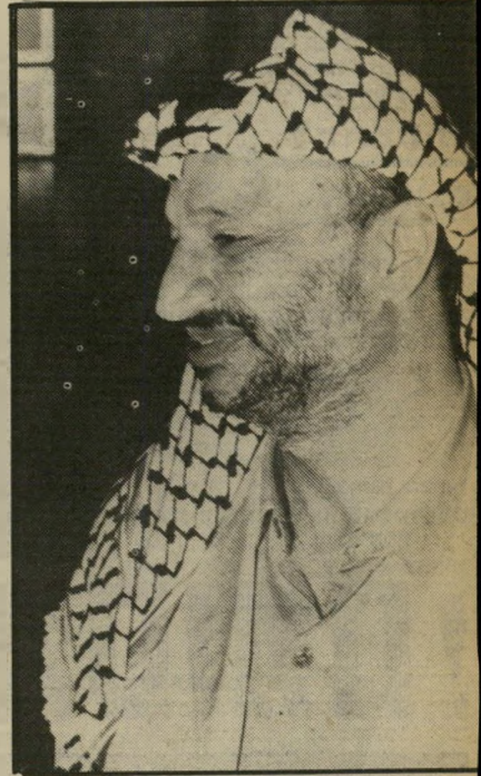
יו"ר ערפאת הזמנה לאלג'יר?

(אחרי הפגישה התחרו סוכני-סוריה עם יצחק שמיר, ושאר הטרוריסטים בעבר