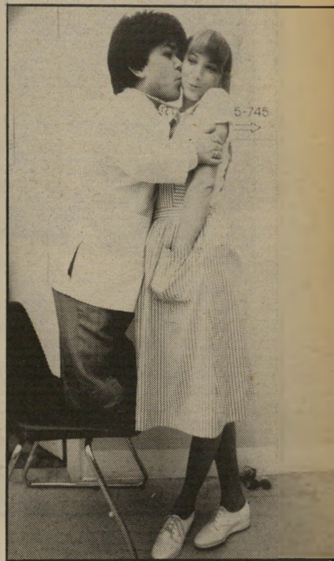
רופא ואחות מתמחים להגיע לגובה הזווה

הקולנוע האמריקאי ממשיך לרכוב על גגל של סרט חטונג וטיסה נעימה, ולי עקעק את כל הקדוש והנאצל בתרבות