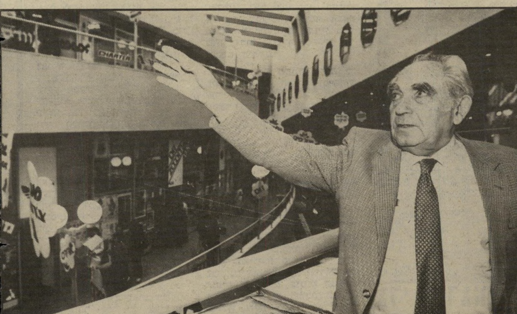
הפילג של הפיל פילג, שיזם את הפרוייקט, משקיף מגבוה בהנאה איש-העסק קים אריה הישראלי יתרגל לבן בתל-אביב, אבל ידעתי כי יבוא יום והקהל אמרו שנשכחתי, שזהו עוד פיל למרכז גדול וינהר הנה בהמוניו.

(המשך מעמוד 51) סמתי מודעות קטנות בעיתונים, והצעתי עסק תמורת 50 דולר. אנשים התחילו לבוא בהמוניהם. מיינתי את האנשים ותוך חודשיים הושכרו 50 עסקים. היום פועלים פה 221 עסקים — בנקים, מישר-רדייתיות, סרפומריות, בתי-קולנוע, גלריות, בוטיקים ובתי-קפה. בסך-הכל נשארו עוד 32 עסקים שנתרו עדיין להשכרה, כולל קר מה ג' קומה א' מאוכלסת כולה, קומה ב' — פרט לשישה עסקים — אף היא מאוכלסת. ובאמת, הי מקום היום דומה לעיר קטנה, יש חנייה, בחורף חם, בקיץ מקרר ומאוורר."