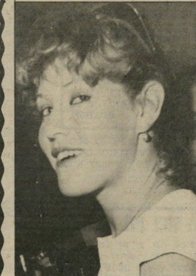
נטע רמון דמות אלמונית

היא שוב כאן. אבל הפעם, כך אומרים, היא תשהה בישראל שלושה חודשים תמימים. האם תוכל להתבודד בחדרה כל הזמן, מבלי למצוא ולוא ישראלי אחד בעל סטיל, שיענה על דרישותיה?