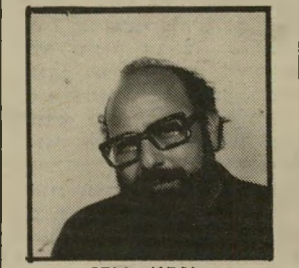
קורא גידון חוק ואמץ

קלגסים כחול-לבן. לאחרונה שמע הציבור לא מעט על בעיות הנעדרים, אותם אנשים שנעלמו בארצות אמריקה הדר-רומית ואיש אינו יודע היכן מ-קום הימצאם. רק מעטים שמו לב, כי מאז תחילת מלחמת-לב-נון יצרנו גם אנחנו מצב דומה. בימיה הראשונים של המיליח-מה נאסרו אלפי אנשים, לבנונים