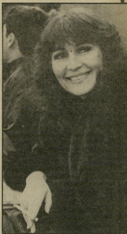
אוהדת ברנסם אליפות משולשת