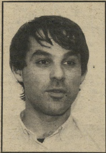
מתמחה רובנקו חקירה