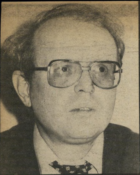
פרקליט ויינרוט חדמה