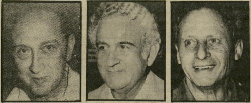
שחם קומיסרים תרבותיים ברטוב גיחות קרבות מגד איבוד צלם

בתהליך התפתחותה של הספרות העבי רית ומיצוי התיקות שהוטלו עליה, במשך יותר משלושים שנה, היוו סי פריהם של אהרון מגד, חנוך ברטוב, נתן שחם ואחרים לכלם בדרך התפתחו"תה של הספרות העברית והישראלית. בחינת דור ספרותי שאיבד את זימונו עם החיים הספרותיים בארץ.