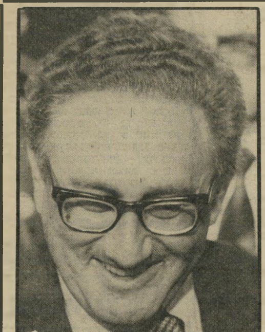
הנרי קיסינג'ר אל-קאפונה פוליטי

קיסינג'ר נהנה, כמובן, מזיכרונו הקצר של הי קורא במערב, וגם מהעובדה שפשעיו זכו לדיווח מצומצם וסלקטיבי בארצות-הברית. לעומת זאת, מרי דעם רוב האינטלקטואלים במערב-אירופה לעובדה שהוא אחראי ישיר לביצועם של פשעי-מילחמה חמורים בווייטנאם ובעיקר בקאמבודיה. ההפצצות המאסיביות, ותפקידו המכריע של קיסינג'ר בעקיפת