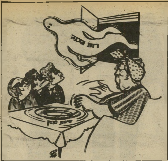
קריקטורה של פרץ ב"עז המושמר" שיחות בין סוס ורוכבו

רוח הכתבה, הספוגה טרוניה על השליטנות המתאכזרים לרוצח-חיהגשים, מעודדת בלי ספק את הפשע המתועב הזה. האם המח