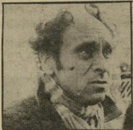
קורא לוי לנחות על השמש

לשר-המדע, יובל נאמן, בעי"ח "ק ירושלים השל" מה שחובנה לה יחדיו תוב"א.